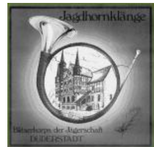
Das Cover der Schallplatte und der CD

Der Wunsch, eine Plattenaufnahme durchzuführen, existierte im Bläserkorps schon lange. Für die Realisierung dieses zunächst kostspieligen Vorhabens sorgte Thomas Ehbrecht im Jahre 1987. Im Frühjahr dieses Jahres setzten sich die Bläser an mehreren Wochenenden mit den Tücken von Mikrofon und Tonband auseinander. Heraus kam eine Aufnahme, die mehr ist, als eine schöne Erinnerung, sich bis zum heutigen Tage sehr gut verkauft und mittlerweile die Kosten wieder eingespielt hat.