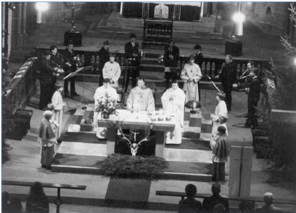
12.11.1982 die erste selbst geblasene Hubertusmesse der Duderstädter Jagdhornbläser in der St. Cyriakuskirche zu Duderstadt

Zurück zum Parforcehorn. Am 12.11.82 war es soweit: das Jagdhornbläserkorps Duderstadt gestaltete die erste eigene Hubertusmesse in der St. Cyriakuskirche zu Duderstadt, dem "Eichsfelder Dom". Seitdem umrahmten unsere Bläser fast alljährlich zu Hubertus eine Messfeier zu Ehren des Schutzpatrons der Jäger, meist in Duderstadt, aber auch in Gieboldehausen, Desingerode und Seulingen. Zahlreiche Hubertusmessen gestalteten sie inzwischen aber auch im befreundeten Umland, wie z.B. in Osterode und – nach der Grenzöffnung – in Worbis und sogar auf der Insel Usedom.