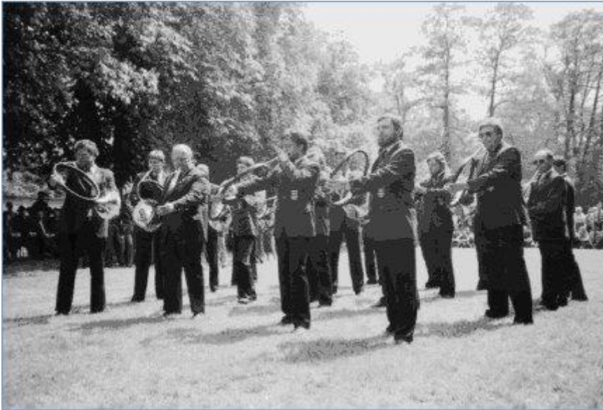
24.05.1987 Schaublasen nach den Deutschen Meisterschaften mit den Parforcehörnern.

das Bläserkorps Duderstadt diese Feier. Ein weiterer Kontakt zu einer ostdeutschen Bläsergruppe – den Bläsern von der Insel Usedom – entwickelte sich 1997. Er führte zu einer Fahrt nach Mecklenburg-Vorpommern, wo in Hehringdorf ein Konzert und im Ort Usedom eine Hubertusmesse gestaltet wurde.